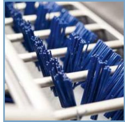
Robuste Nylonbürsten Robust nylon brushes