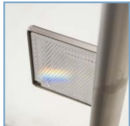
Personenerkennung dank Lichtschranke Recognizes user by light barrier