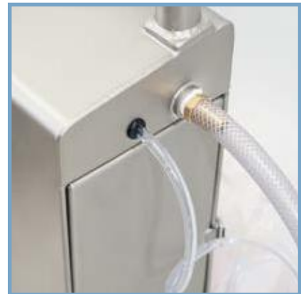
Separate Zuführung der Reinigungsmittel Detergents separately addable