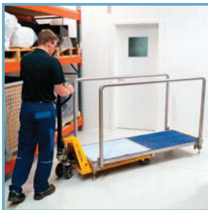
Flyttbar med pallyftare / Mobile due to fork lift pick up