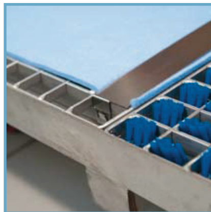
DryPad sätts enkelt fast med två klämmor och går snabbt att byta ut / The Drypad is easily fixed with 2 clips and can be quickly replaced