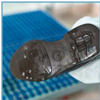
Våt rengöring och desinfektion / Wet cleaning and disinfection