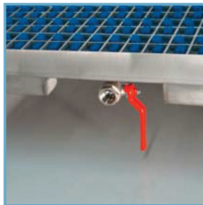
Vätska tappas enkelt av genom kulventilen / The fluid is conveniently drained via a ball valve

Due to the capillary effects, the micro-toothed textile fibre actively draws moisture off the soles.